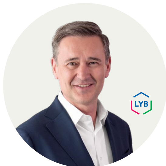
Peter Vanacker ประธานเจ้าหน้าที่บริหาร

เพื่อให้มั่นใจว่าพนักงานทุกคนเข้าใจภาระหน้าที่ของพนักงาน แนวทางปฏิบัติมีให้เลือกรุ่นได้ 17 ภาษา และเสริมด้วยการอบรมรายปี หากคุณมีข้อกังวลใด ๆ หรือรู้สึกว่าคุณไม่ได้รับการปฏิบัติตาม ผมขอให้คุณแจ้ง หากมีข้อสงสัย โปรดอย่าลังเลที่จะติดต่อฝ่ายกำกับดูแลการปฏิบัติตามกฎระเบียบทางอีเมลโดยใช้รหัสคิวอาร์ด้านล่าง